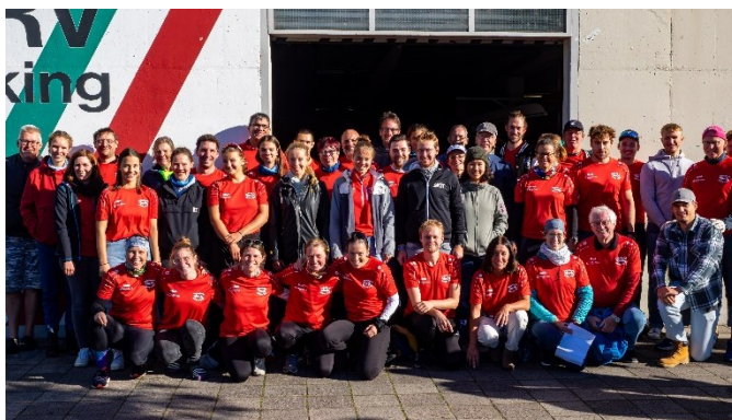
Helferfoto der Wiking-Mitglieder, die den LVK möglich gemacht haben.

Nochmal herzlichen Dank allen, die im Vorfeld, im Orga-Team, beim Aufbau und schlussendlich der Durchführung geholfen haben. Ohne euch könnten wir solche Events nicht veranstalten.